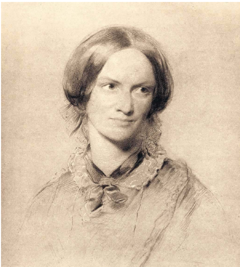
Charlotte Brontë (1816-1855), tekening van George Richmond uit 1850