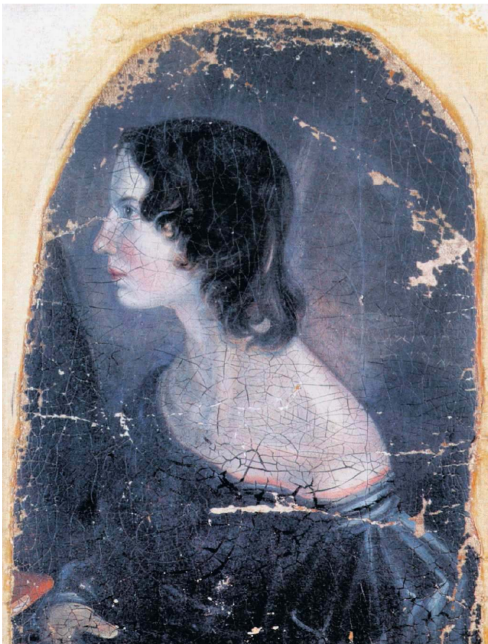
Emily Brontë (1818-1848) tekening van Patrick Branwell Brontë uit 1833

terende art-nouveaugebouw Old England. Op de bovenste etage kun je eten en drinken en genieten van het uitzicht op de stad. Verder Brussel in, op weg naar de Grote Markt? Een heerlijk glas bier drink je bij A la Mort Subite, Warmoesberg 7. Dichter bij de Grote Markt, in Galerie de la Reine, kun je genieten van koffie met gebak in Mokafe.