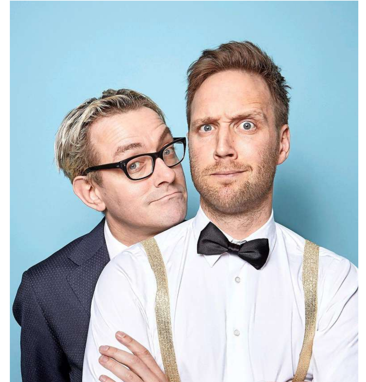
„Kinderen denken meteen: 'Hoezo mag ik het niet lezen?'. Ze doen het dan juist.”

Lees dit boek niet! (Uitgeverij Kluitman, oktober 2020). Met illustraties van Ton de Bree, €16,99.