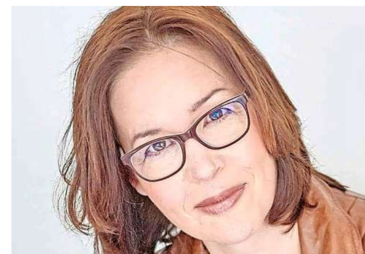
„Help elkaars rugzak te dragen en geef nooit op.”

Waar gaat het boek over? Rasters: „Het boek gaat over een jongen met Down. Het verhaal wordt vanuit zijn perspectief verteld. Hij doet het supergoed in de klas en iedereen is gek op hem. Tot er een nieuwe jongen in de klas komt, Jonas, die hem