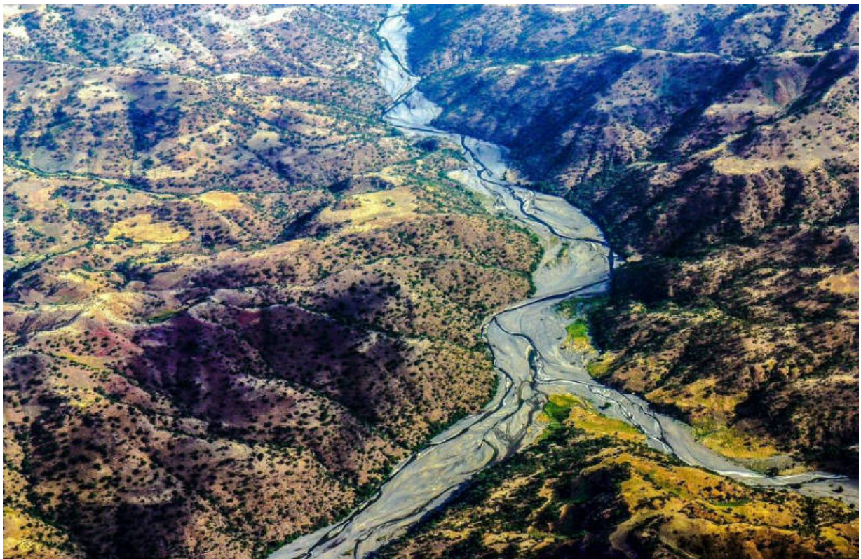
Ethiopië