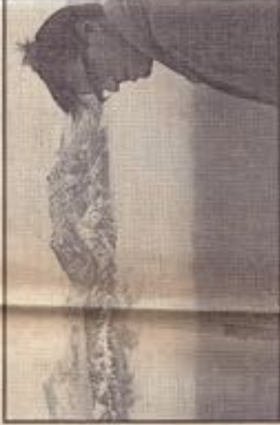
Jeroen Krabbé in Een schicht regenwulpen.