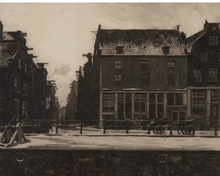
▼ Willem Witsen maakte omstreeks 1905 deze prent van de Zwanenburgwal over de Sint Antoniessluis recht op de Joden Houttuinen.